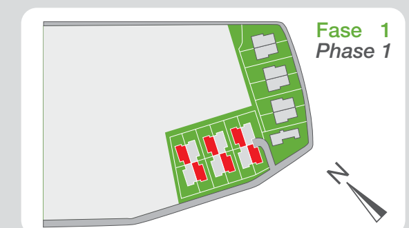
Fase 1 Phase 1